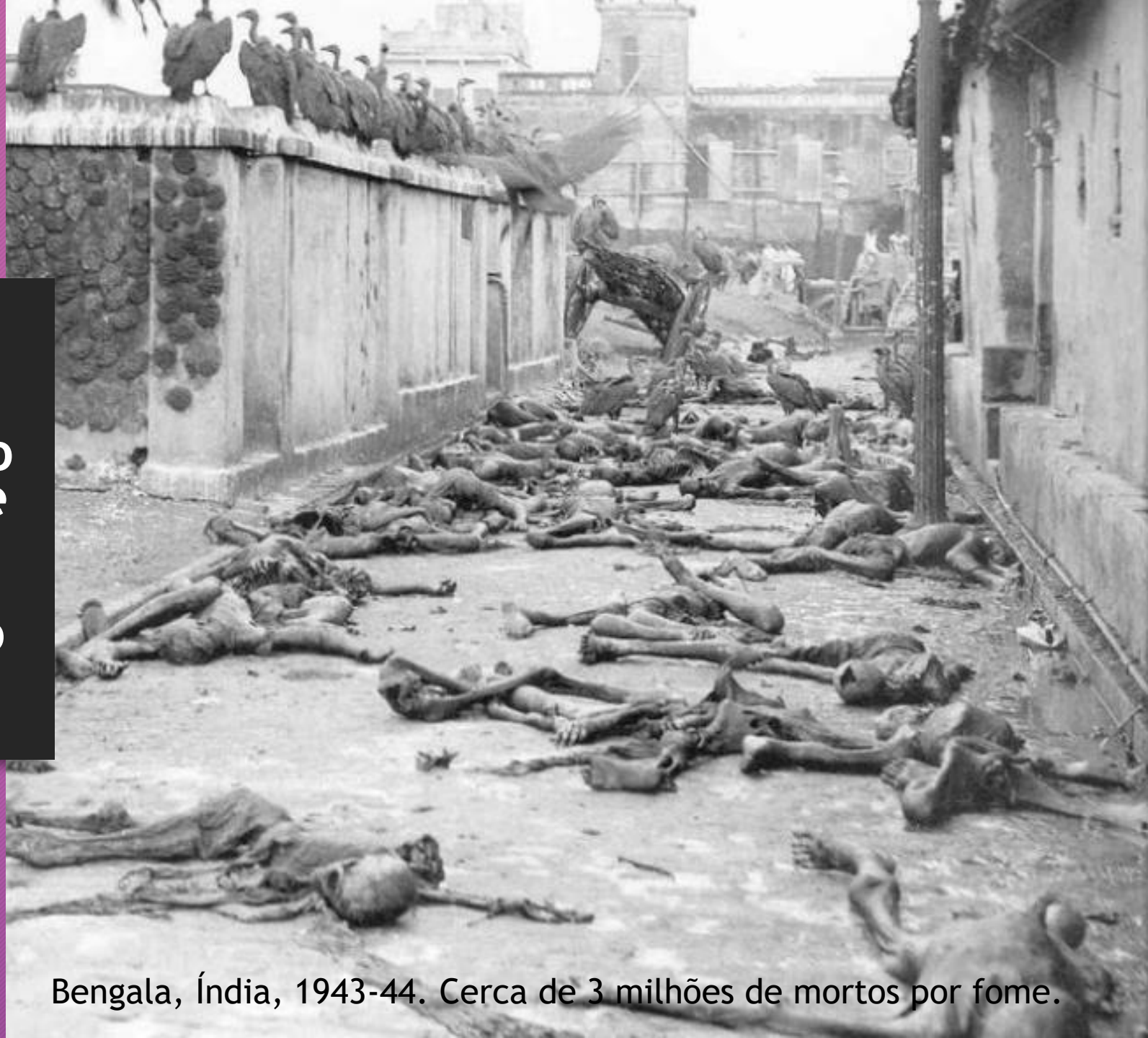
Bengala, Índia, 1943-44. Cerca de 3 milhões de mortos por fome.

Um terço de todos os alimentos produzidos no mundo são jogados no lixo - cerca de 300 milhões de toneladas por ano, com grave impacto no desmatamento e poluição das águas. (ONU, 2015)